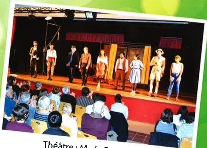
Théâtre : M. de Pourcegnac