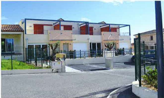
Logements aidés Clos des Cigalons

Les logements aidés prévus dans les lotissements « Le Clos des Cigalons » et « le Mas de Zolana » sont maintenant terminés. Ils ont été attribués et leurs occupants ont emménagé. La commune a pu proposer des jeunes couples de Saint-Gervasy démarrant dans la vie ou des familles passagèrement en difficulté à