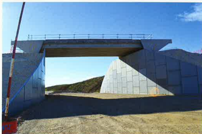
Pont de la route de Redessan au-dessus de la voie ferrée

Le paysage de la plaine est en train de changer... des ouvrages d'art spectaculaires sont en construction : deux ponts qui passeront au-dessus de la voie nouvelles ont surgi, l'un immédiatement au sud de la voie existante : il permettra le franchissement de la voie par la départementale vers REDESSAN, et le rétablissement des chemins « Bas de Meynes » et