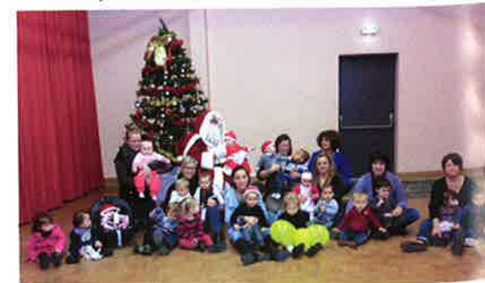
Noël des Petites Fripouilles