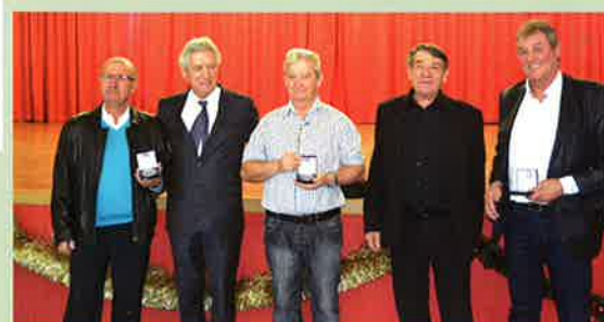
Quatre anciens élus honorés