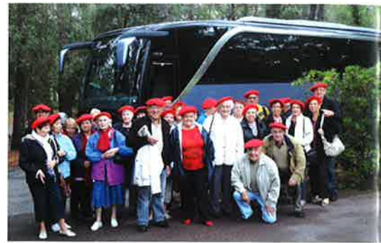
Ventoux à St-Gervasy. Tél. 04 66 75 28 46.