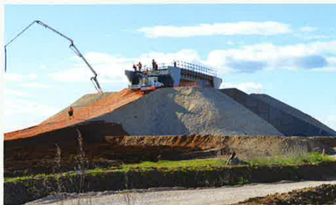
Pont chemin des canaux au-dessus de la voie ferrée

D'autres ponts moins élevés franchiront les fossés et notamment le Vistre, tant pour la route que pour la voie ferrée. Plus à l'ouest un autre ouvrage permettra à « la virgulette » de franchir le fossé de la Bastide.