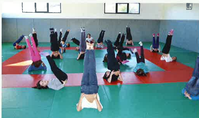
Atelier danse au dojo

Cette nouvelle organisation fonctionne avec une soixantaine d'enfants présents aux TAP en élémentaire et une trentaine en maternelle. Il s'agira maintenant au cours des années qui viennent, de perfectionner et diversifier ces ateliers pour les rendre le plus intéressants et profitables possible pour les enfants.