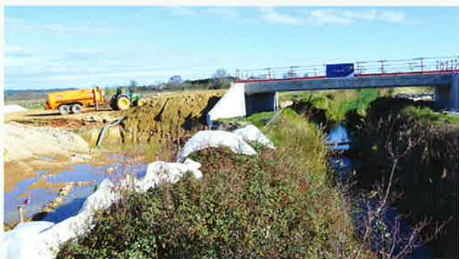
Pont route de Redessan au-dessus du Vistre