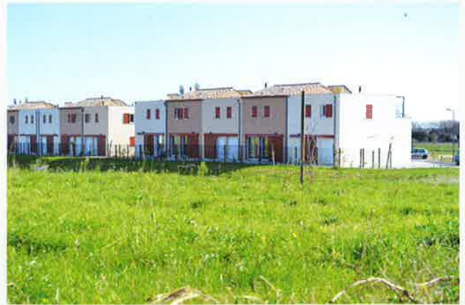
Logements aidés Mas de Zolana

Autres logements locatifs : de nombreux logements sont loués en centre village. Des aides existent pour les propriétaires qui réalisent des aménagements à leur appartement pour le rendre plus confortable et économe en énergie... renseignements en Mairie.