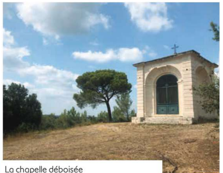
La chapelle déboisée