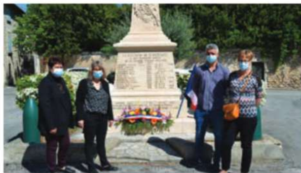
Dépôt de gerbe au monument aux morts

Le 8 mai, une gerbe a été déposée au monument aux morts en hommage aux soldats de la commune, victimes des guerres.