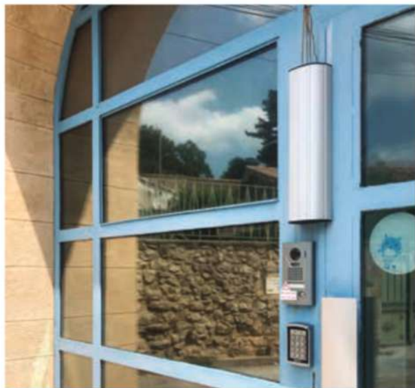
Interphone-vidéo de la crèche

À la crèche, l'installation électrique a été mise en conformité et un kit vidéo a été installé pour sécuriser les entrées et les sorties. À l'école, l'appartement a subi une réfection électrique. Un point d'eau chaude a été mis en place dans le couloir desservant quatre classes. Un mécanisme d'ouverture sécurisée à distance a été installé dans la salle servant de garderie hors temps scolaire. Concernant la cantine, une armoire réfrigérée a été achetée pour remplacer l'existante qui ne fonctionnait plus et un contrat d'entretien a été mis en place pour l'adoucisseur d'eau.