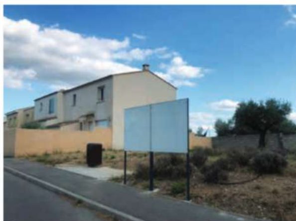
Panneau d'affichage de Zolana

Ils sont libres d'utilisation mais destinés essentiellement aux associations pour y afficher ponctuellement la publicité relative à leurs activités sans but lucratif.