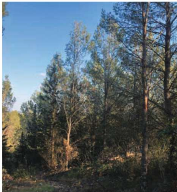
Déboisement de la colline

Dans deux ou trois ans, les arbres conservés auront pris du volume pour constituer une belle forêt résistante, accessible et moins sensible au feu.