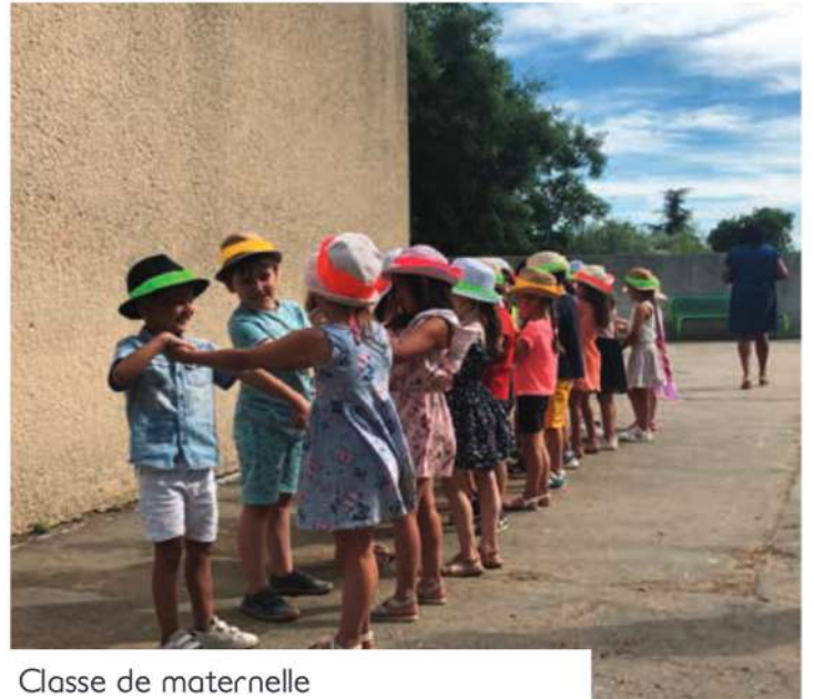
Classe de maternelle