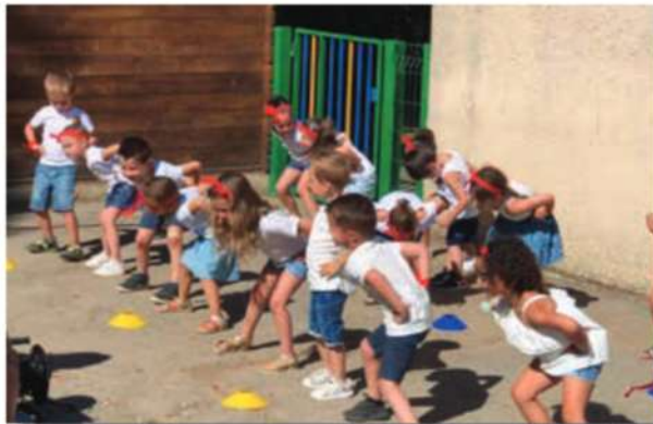
Classe de maternelle

(La décision de fermeture sera toutefois confirmée ou infirmée le jour de la rentrée, suivant les effectifs du jour.)